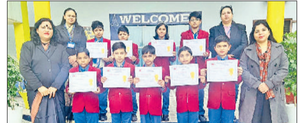
रोहतक। शिक्षकों संग प्रतियोगिता के विजेता विद्यार्थी।