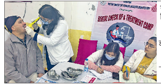
रोहतक। शिविर में जांच करते डॉक्टर।