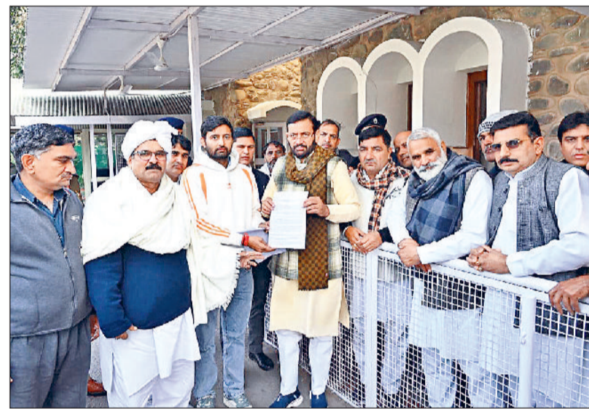
रोहतक। मुख्यमंत्री नायब सिंह सैनी से उनके निवास पर मिलते सर्वखाप पंचायत के 17 सदस्यीय प्रतिनिधिमंडल।